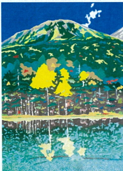
「雌阿寒岳とオンネトー」

最後に、この様な厳しい環境の中、公募展を開催し、作品の発表の場を設けて頂いた皆様に改めて感謝をいたします。一刻も早く現在の状況がおさまリ、平穏な日常が戻ることを祈つてやみません。