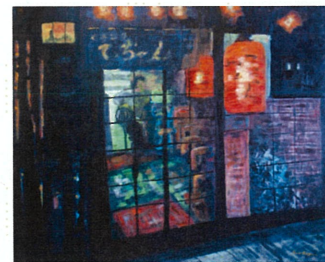
「ひと息つきたいね・・・」

この度、思ってたいなかった美術館賞を頂き、身に余る光栄であり、非常に嬉しく思っております。皆様のご指導の賜物と深く感謝申し上げます。今回の作品のタイトルは、「ひと息つきたいね」です。新型コロナウイルスの緊急事態宣言で飲む機会がなくなり、ただ、通り過ぎていくだけで、さびしく感じます。その気持ちを表して描きました。一日でも早く仲間と飲みたい人はいると思います。この絵画を見て癒しになればと思います。このような絵が評価され、本当に嬉しく思います。受賞を励みに今後共楽しく絵を描いていきたいと思っています。